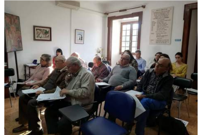
Reunião da Assembleia Geral da SCM de Góis, na Sede da Provedoria