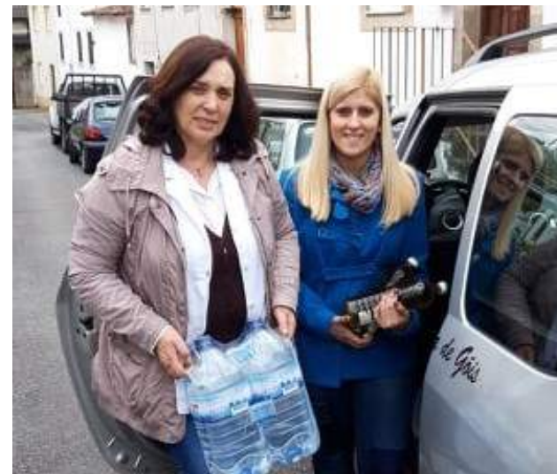
SCM de Góis apoia Povo de Moçambique, com a entrega de produtos não perecíveis