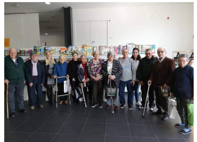
Utentes da SCM de Góis na visita à 23.ª Feira do Livro de Góis