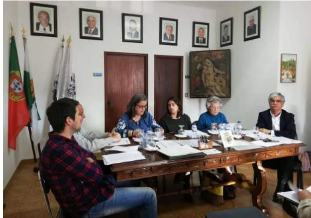
Mesa da Reunião da Assembleia Geral da SCM de Góis

A Mesa Administrativa da SCM de Góis reitera-lhes votos de sucessos profissionais.