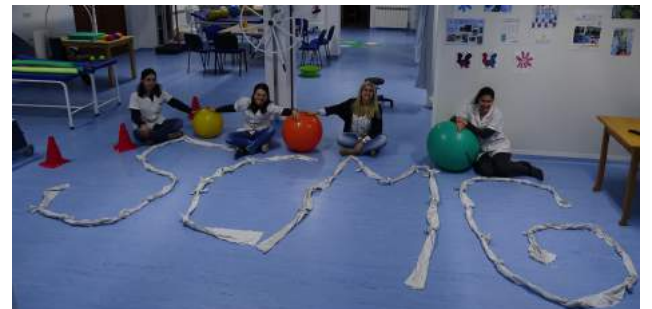
Dia Mundial da Saúde assinalado no Lar de Idosos da SCM de Góis

Início do CATL da SCM de Góis - Férias da Páscoa 2019 O CATL - Centro de Atividades de Tempos Livres - Férias da Páscoa, promovido pela Santa Casa da Misericórdia de Góis, entrou em funcionamento no passado dia 8 de abril e irá decorrer na Sala de CATL instalada no edifício do Lar de Idosos, em Vila Nova do Ceira, até ao dia 22 de abril.