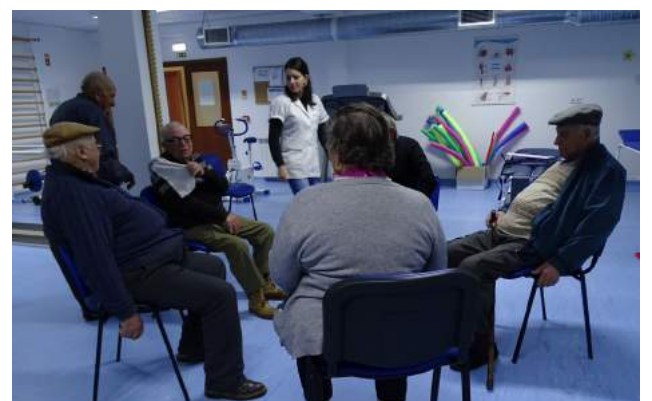
Atelier “A Mexer e a Alongar, Saúde Vamos Ganhar” dinamizado no Centro de Reabilitação Física e Bem-Estar Dr. José Cabeças

Tecnologia avançou E no espaço detetou Infinitos fragmentos O globo os atrai Há uma chuva que cai Raros pingos violentos