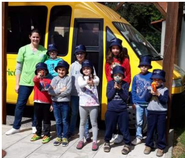
CATL da SCM de Góis - Férias da Páscoa 2019