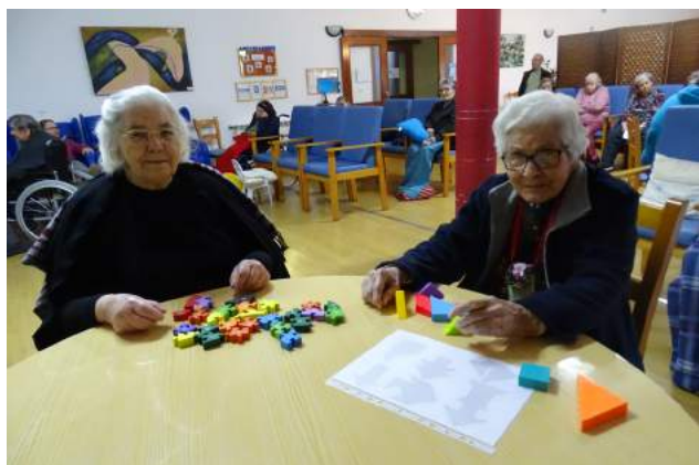
Utentes da SCM de Góis realizaram exercícios de estimulação cerebral no Dia Mundial da Saúde