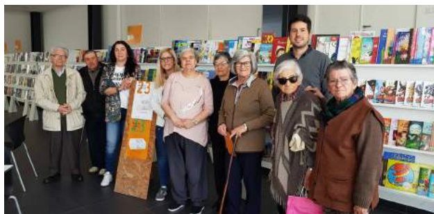
SCM de Góis na Sessão de Abertura da 23.ª Feira do Livro de Góis