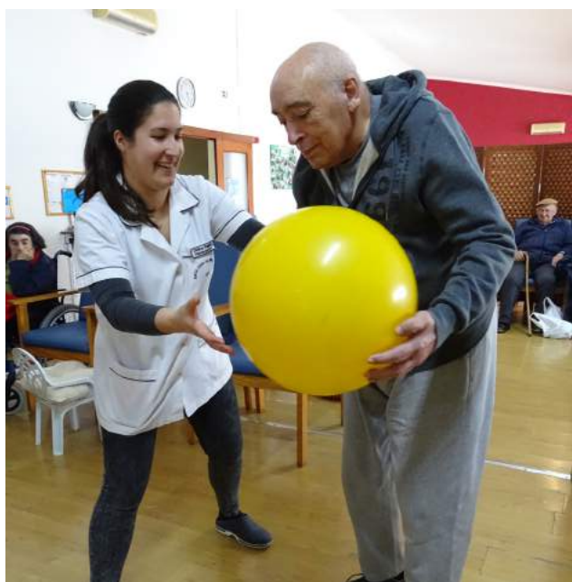
Comemoração do Dia Mundial da Saúde assinalado na SCMG