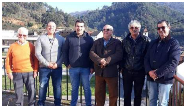
SCM de Góis entrega as Instalações do Ex-Centro de Dia da Cabreira à Comissão de Melhoramento da Cabreira