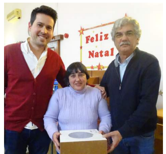
Provedor e Vice-Provedor na entrega dos Bolos-Reis às colaboradoras da Instituição