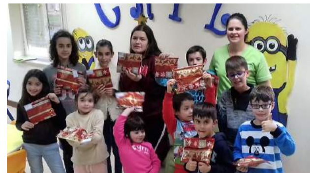
Grupo de crianças do CATL - Férias de Natal 2018