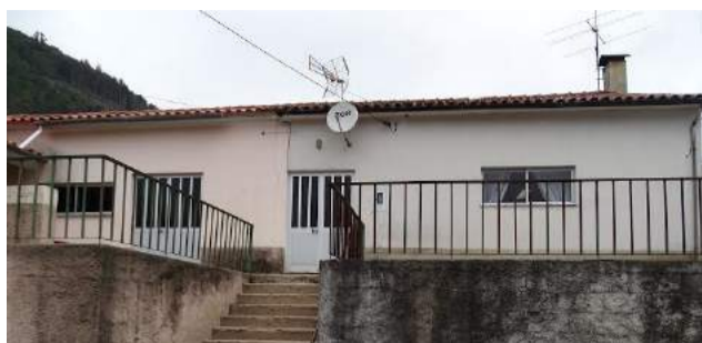
Edifício do Ex-Centro de Dia da Cabreira