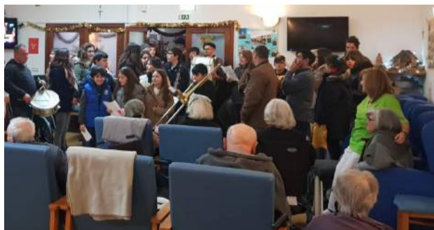
FILVAR visita o Lar de Idosos da SCM de Góis no Dia de Reis