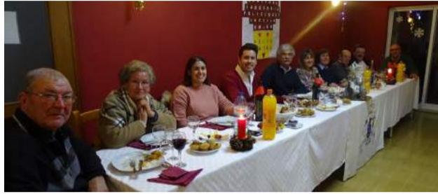
Mesa de honra do Jantar de Reis

Durante as Férias de Natal de 2018, foram muitas as atividades que preencheram os dias das nossas crianças que frequentam o CATL da Santa Casa da Misericórdia de Góis. De entre as várias atividades internas dinamizadas, destacamos o atelier