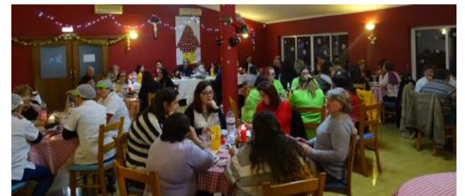
Convívio entre Colaboradores, Voluntárias e Dirigentes da SCM de Góis - Jantar de Reis