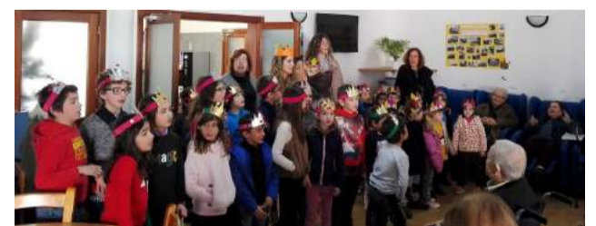
Crianças da Escola da EB1 de Vila Nova do Ceira cantaram as "Janeiras" no Lar de Idosos da Instituição

de mobilidade, o atelier de nutrição, Karaoke, atelier de dança, sessões de cinema, atelier expressão plástica, convívio Inter-CATL'S e as atividades intergeracionais.