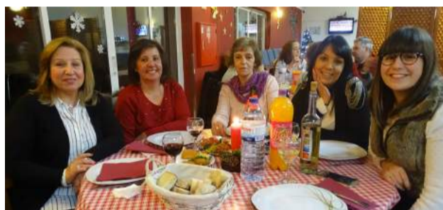
Voluntárias e colaboradoras da SCM de Góis no Jantar de Reis