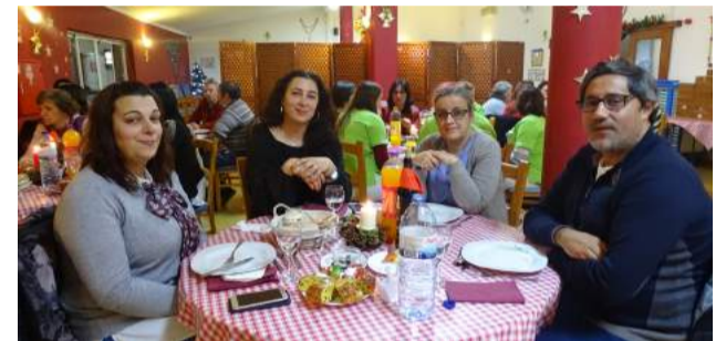
Jantar de Confraternização da SCM de Góis