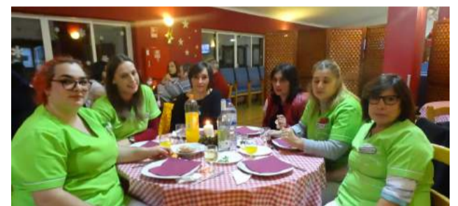
Colaboradoras da SCM de Góis no Jantar convívio organizado pela SCM de Góis