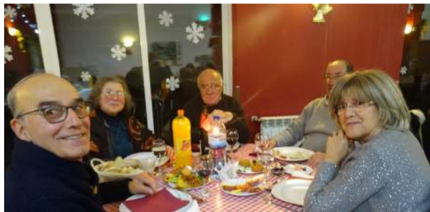
Membros dos Corpos Sociais da SCM de Góis no Jantar de Reis