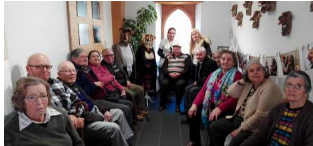
Grupo de utentes na visita à Exposição "Corrida do Entrudo das Aldeias do Xisto de Góis", no Posto de Turismo de Góis