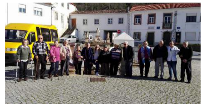
Utentes da SCM de Góis no Largo do Pombal, em Góis