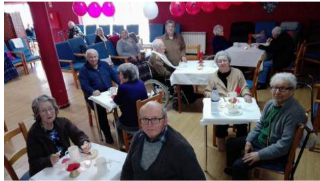
Lanche Romântico - Dia dos Namorados comemorado no Lar de Idosos da SCM de Góis