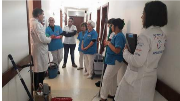
Formação de Higiene Profissional na SCM de Góis - Sector da Limpeza