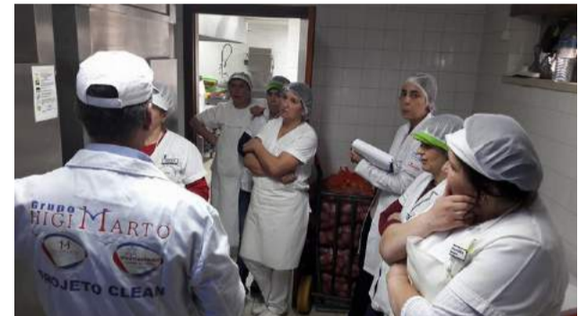
Empresa HIGIMARTO ministra Formação de Higiene Profissional na SCMG- Sector da Cozinha