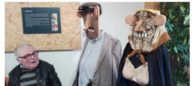
Os utentes da SCM de Góis apreciaram as várias máscaras que andaram à solta no Entrudo das Aldeias do Xisto de Góis