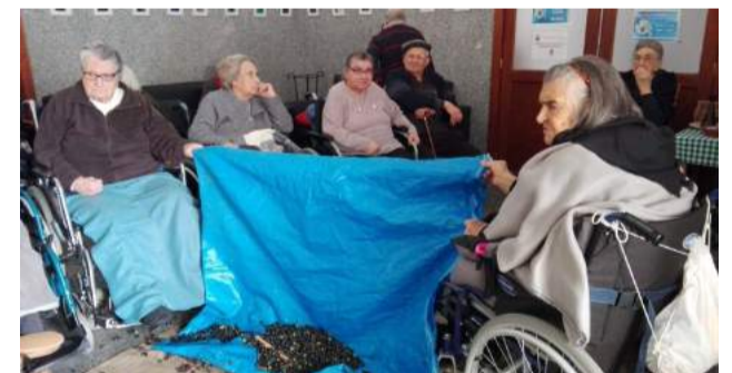
Animação durante a atividade da “Apanha da Azeitona” no Lar de Idosos, em Vila Nova do Ceira

LAR, VNC, 10 de dezembro 2018 Ernesto Rosa