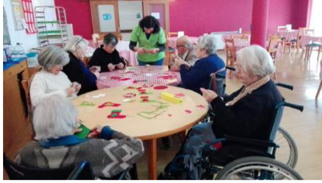
Utentes da SCM de Góis durante a construção dos adereços de Natal