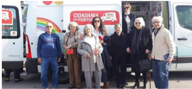
Utentes da SCM de Góis no Workshop “Violência Doméstica sobre a Pessoa Idosa”

é a época do ano em que as pessoas refletem sobre as suas vidas e sobre as suas experiências vivenciadas durante o ano que está a terminar, é uma época onde é essencial a valorização dos verdadeiros sentimentos.