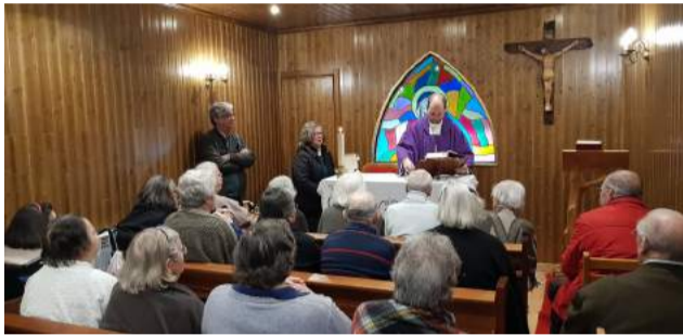
1.º Aniversário da Celebração Eucarística na Capela do Lar de Idosos da SCM de Góis