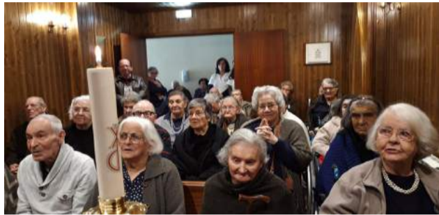
Utentes da SCMG durante a Eucaristia na Capela do Lar, em Vila Nova do Ceira