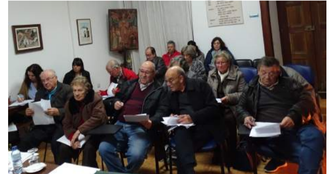
SCM de Góis reunida em Assembleia Geral

O vinte e nove encerra A diferença que se erra Em cada ano que passa Contas são complicadas Para serem acertadas A medida não é rasa A rotação se atrasa Mantendo a grande brasa O cronómetro não perdoa Cada século é notado O relógio adiantado No tempo a soma soa