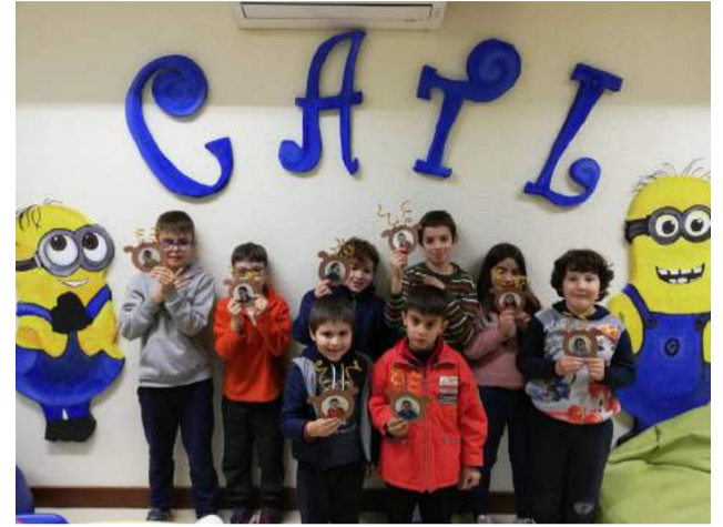
Grupo de Crianças do CATL na preparação da Época Natalícia