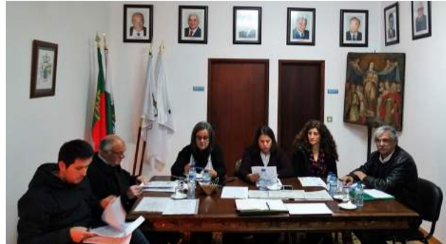
Mesa da reunião da Assembleia Geral da SCM de Góis

Esta é uma época muito especial, para ambas as gerações,