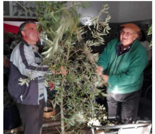
Utentes da SCMG na “Apanha da Azeitona”