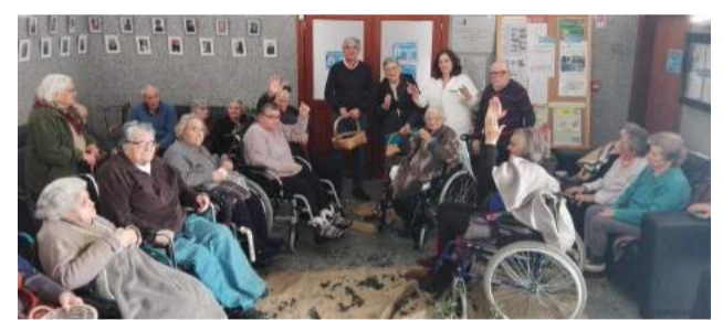
“Reviver a Tradição” - “Apanha da Azeitona” no Lar de Idosos da SCM de Góis