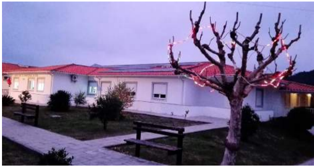
Época Natalícia - Lar de Idosos da SCM de Góis