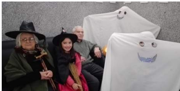
Atividade Intergeracional - Comemoração do Halloween