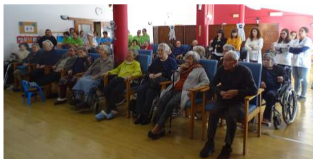
Exercício Público de Sensibilização para o Risco Sísmico A TERRA TREME realizado no Lar de Idosos da SCM de Góis