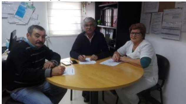
SCM de Góis promove integração profissional

Nem sempre havia cresta Da colmeia o que resta Temos que deixar ficar No inferno tem de haver Para a colmeia sobreviver Ou morrerá sem manjar Para com elas lidar E problemas não ter Máscara se deve usar Elas mordem e vão morrer