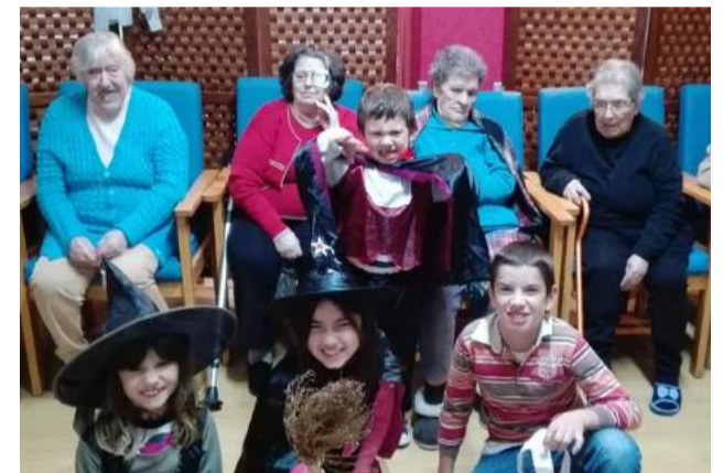
Utentes de ERPI e crianças do CATL na comemoração do Dia das Bruxas