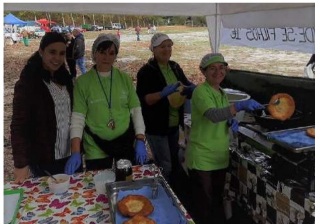
SCM de Góis na Feira dos Santos, do Mel e da Castanha