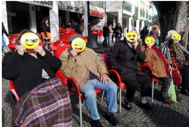
Utentes da SCM de Góis no Desfile de Carnaval