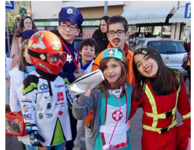
Crianças do CATL da SCM de Góis no Desfile de Carnaval pelas ruas da Vila de Góis