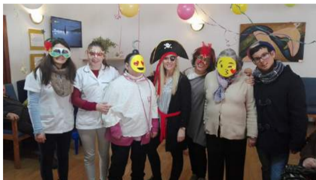
Comemoração do Carnaval na SCM de Góis