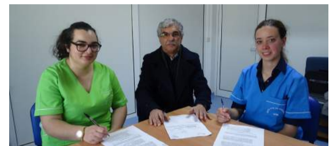
SCM de Góis promove integração profissional - Medidas do IEFP