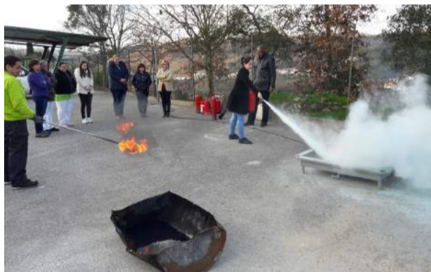
Formação em Ação de Emergência na SCM de Góis - Componente prática