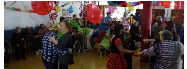
Comemoração do Carnaval na SCM de Góis