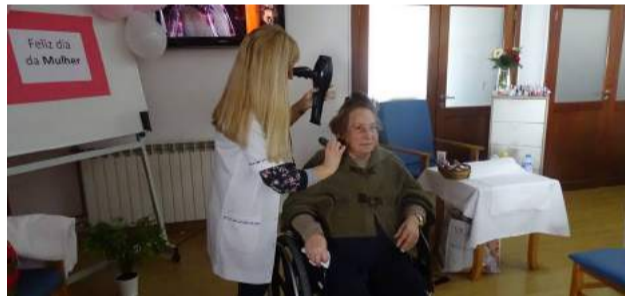
Atelier de Beleza - Serviço de Cabeleireiro - Comemoração do Dia Internacional da Mulher no Lar da SCMG