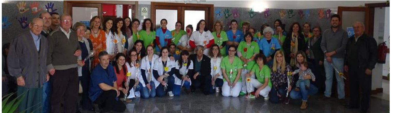
Dia Internacional da Mulher - Colaboradoras, utentes e voluntárias da SCMG recebem uma flor