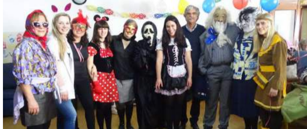
Baile de Máscaras no Lar de Idosos da SCM de Góis