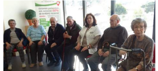
Utentes da SCM de Góis presentes na atividade Roteiro e Cidadania em Portugal