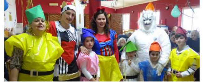
Desfile de Carnaval - Crianças do CATL da SCM de Góis