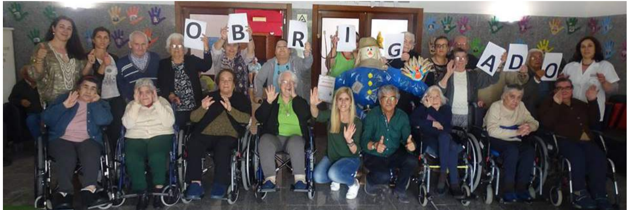
SCM de Góis - 1ª Classificada no Concurso Municipal de Espantalhos

“Procurei os serviços da Santa Casa quando fracturei o meu