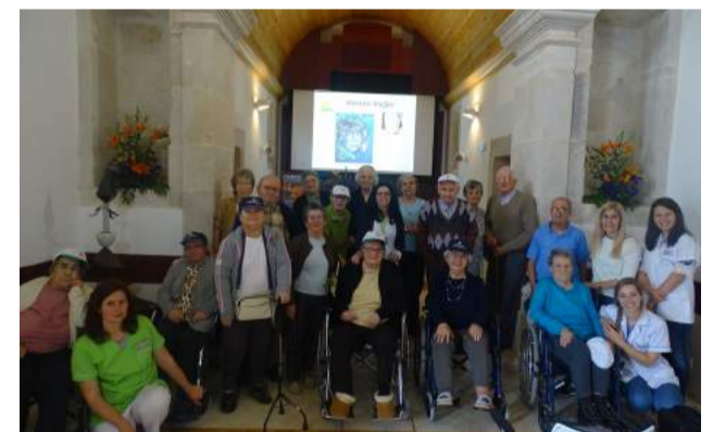
Utentes da SCM de Góis visitam a Exposição “Varzeartes” - “Palavras com Cor”