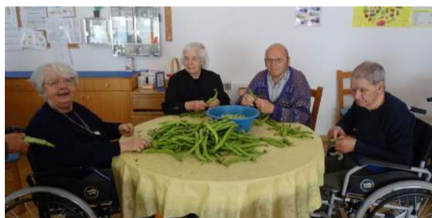
Atividade “Recordar é Viver” - Utentes da SCM de Góis debulham favas