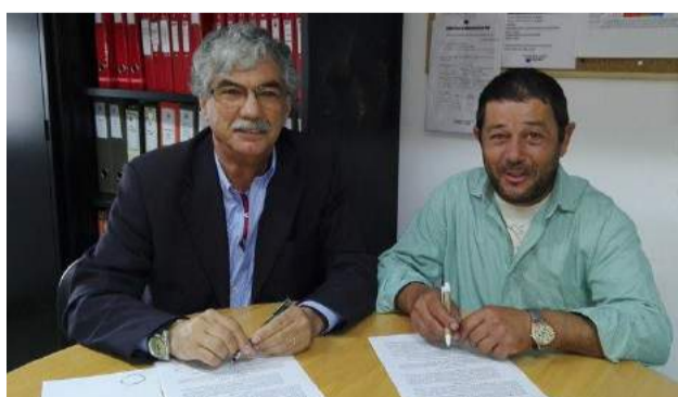
SCM de Góis promove integração profissional