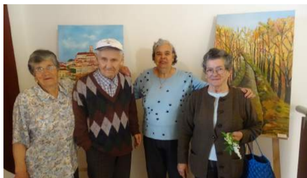
Exposição “Varzeartes”, no Espaço Multiusos - Capela da Costeira