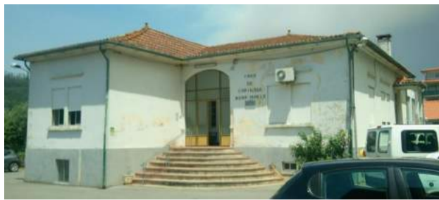
CMSAS – Ex. Hospital de Caridade Rosa Maria