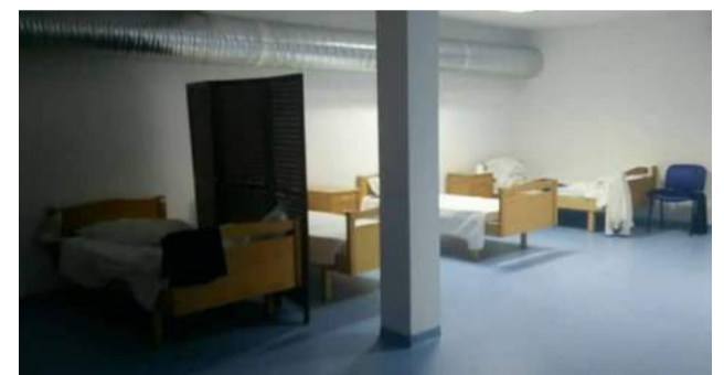
Camas colocadas no rés-do-chão do Lar de Idosos, em VNC