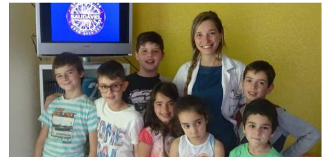
Crianças do CATL brincam ao jogo “Quem quer ser Saudável”