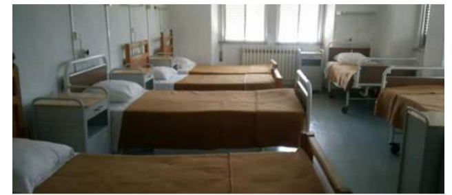
Interior das instalações do Ex. Hospital Rosa Maria