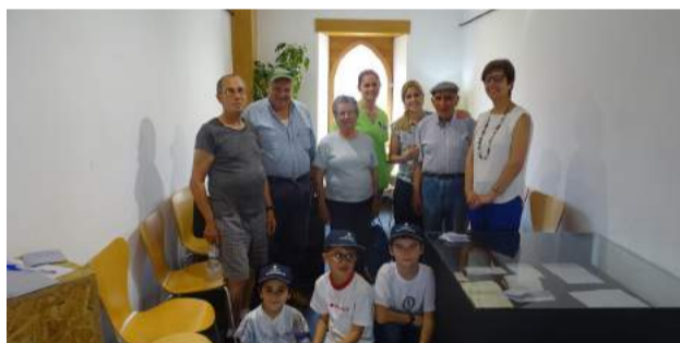
Utentes e Crianças do CATL da SCM de Góis na Exposição “Viagem das Palavras, Através dos Sentidos”