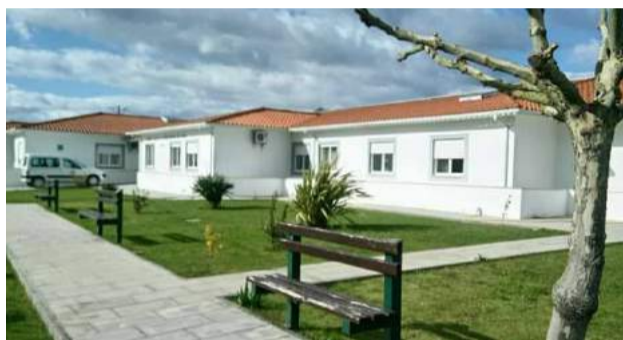
Lar de Idosos da SCM de Góis, em Vila Nova do Ceira