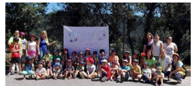
Convívio Inter-CATL'S - Férias de Verão

Terminada a atividade, as crianças rumaram à Praia Fluvial das