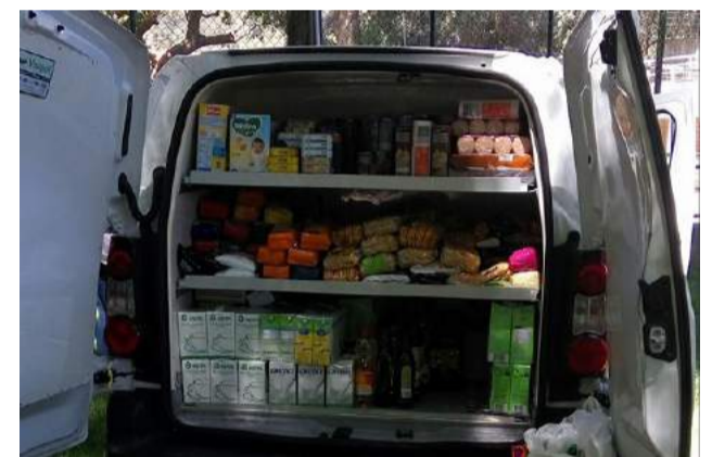
Produtos doados à SCMG durante o VI Encontro Nacional de Verão do Clube Alfa Romeo Team