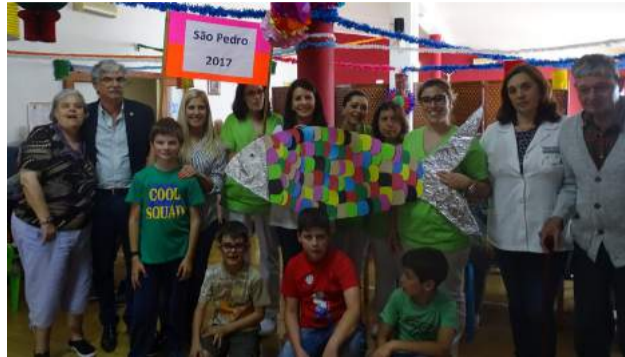
Comemoração do Dia de São Pedro no Lar de Idosos da SCM de Góis

O arraial terminou com a realização de um lanche-convívio que uniu à volta da mesa a “família” da Misericórdia de Góis.