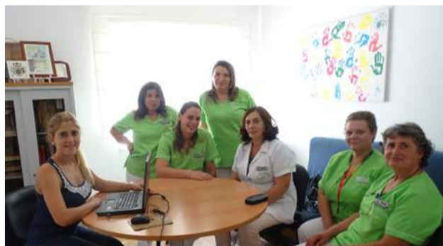
Colaboradoras da SCM de Góis em Formação Interna na área de Psicologia Clínica