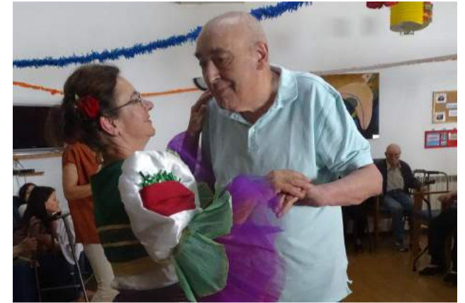
Arraial dos Santos Populares