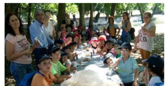
Lanche convívio Inter-CATL'S na Praia Fluvial das Canaveias

Canaveias para almoçarem e usufruir daquele bonita paisagem. A tarde terminou com um lanche convívio, oferecido pela nossa Instituição.