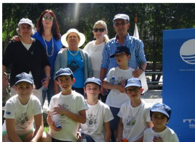
Idosos e crianças do CATL da SCMG na Cerimónia do Hastear das Bandeiras Azul, de Ouro e Praia Acessível