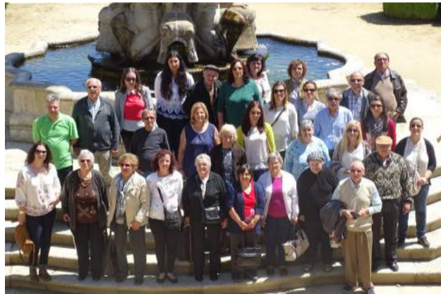
Passeio da Instituição a Lamego e Peso da Régua