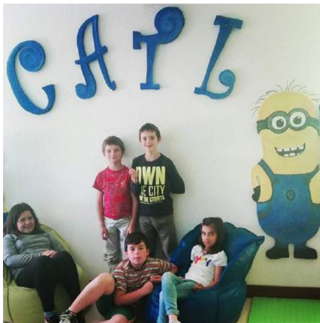
Início do CATL - Férias Ativas de verão