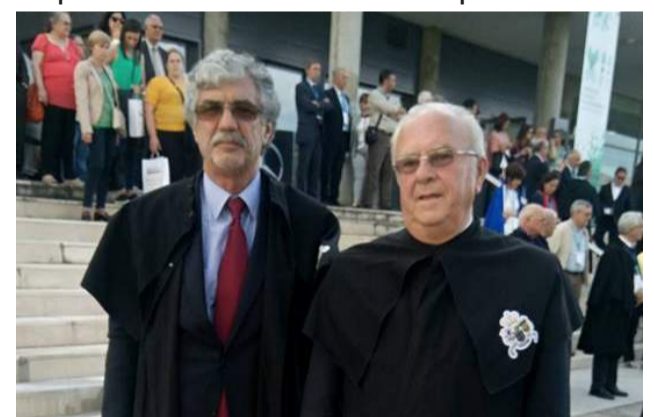
SCM de Góis representada no XII Congresso Nacional das Misericórdias