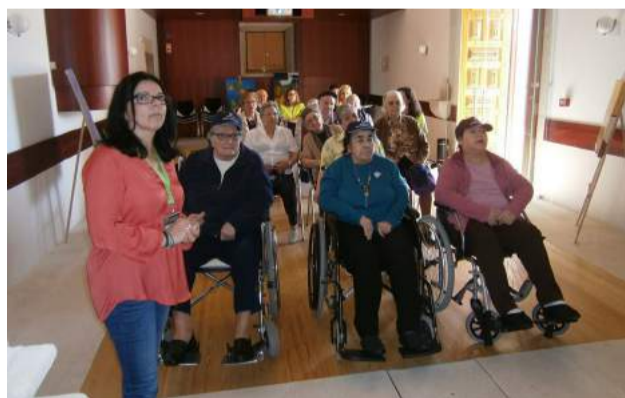
Utentes da SCM de Góis na visita à Exposição "1ª VarzeArtes - Pinceladas da Terra"

Este Congresso decorreu no Fundão e teve como tema "Misericórdias: Marca de Solidariedade". Diversas personalidades marcaram presença, nomeadamente, o Sr. Presidente da República, Prof. Doutor Marcelo Rebelo de Sousa, e o Ministro do Trabalho, Solidariedade e Segurança Social, José Vieira da Silva.