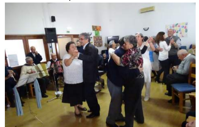
Utentes, Colaboradores e Dirigentes da SCM de Góis, animados durante o espetáculo musical dinamizado pelo Grupo Instrumental da Câmara Municipal de Arraiolos