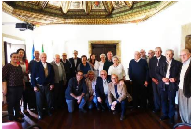
Grupo Instrumental Sénior da Câmara Municipal de Arraiolos no edifício Paços do Concelho